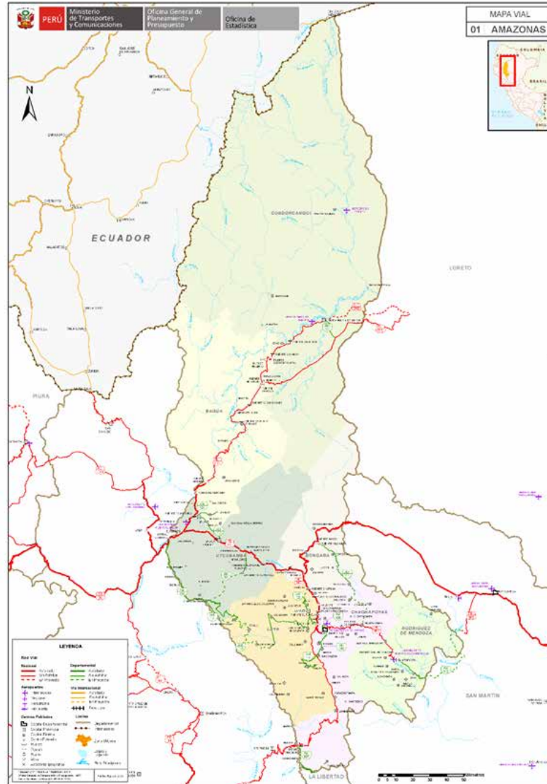
Mapa 2: Mapa vial de Amazonas