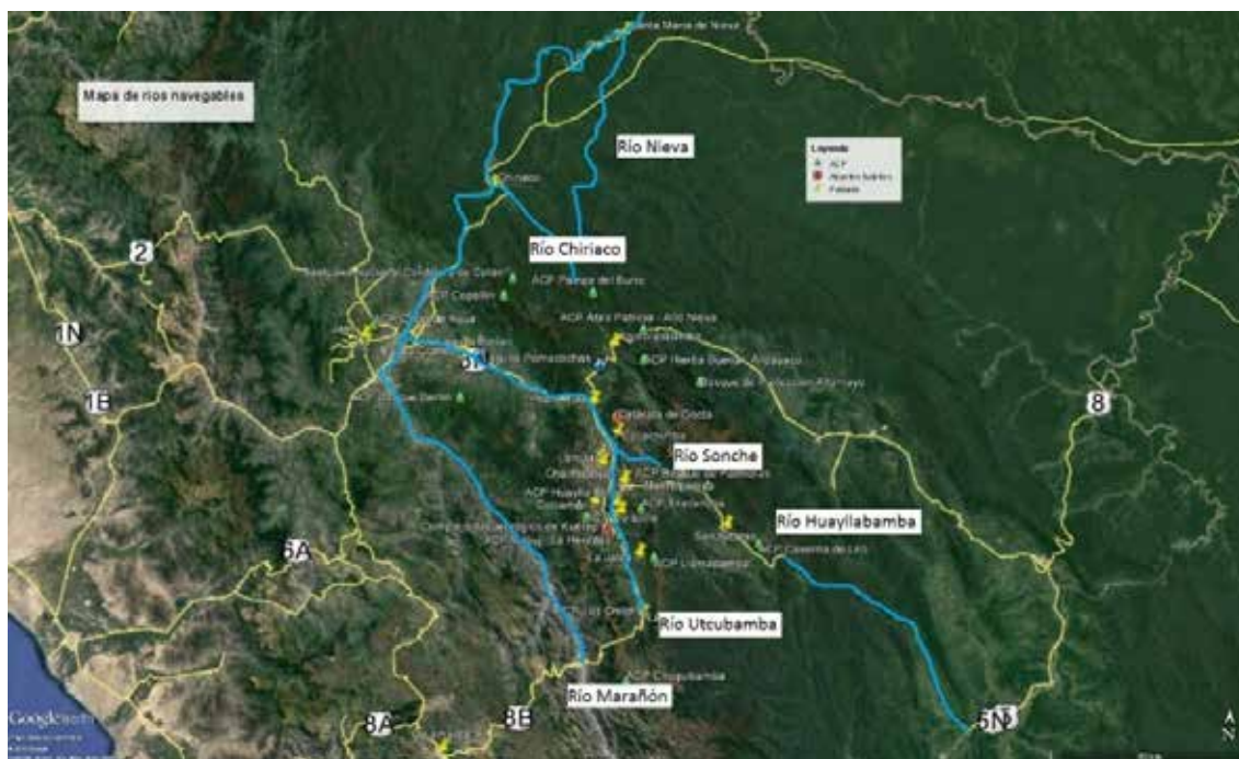
Mapa 6: Ríos con secciones para navegar en kayak y canotaje