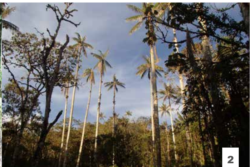
1. ACP Huaylla Belén 2. ACP Bosque de Palmeras C.C. Taulía Molinopampa