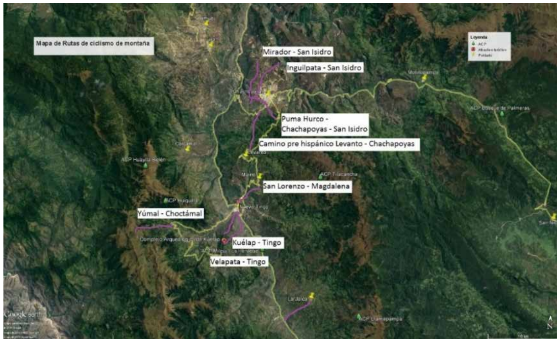
Mapa 5: Ruta para bicicleta de montaña o caminata Kuélap - Tingo Viejo