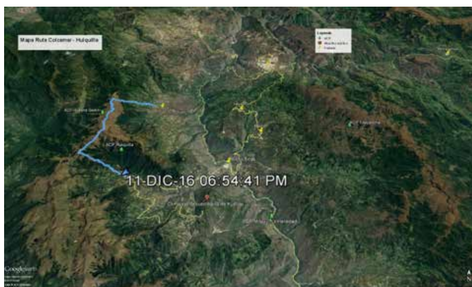
Mapa 3: Ruta de caminata Colcamar - Huiquilla